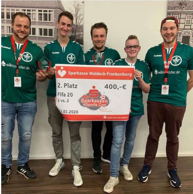
Bild: eSport-Event mit 2.Platz am 15.01.2020